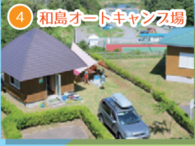
4 和島オートキャンプ場