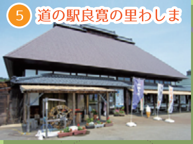
5 道の駅良寛の里わしま