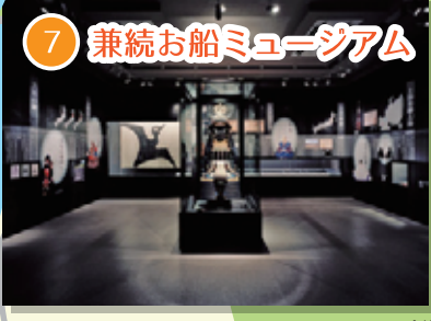
7 兼続お船ミュージアム